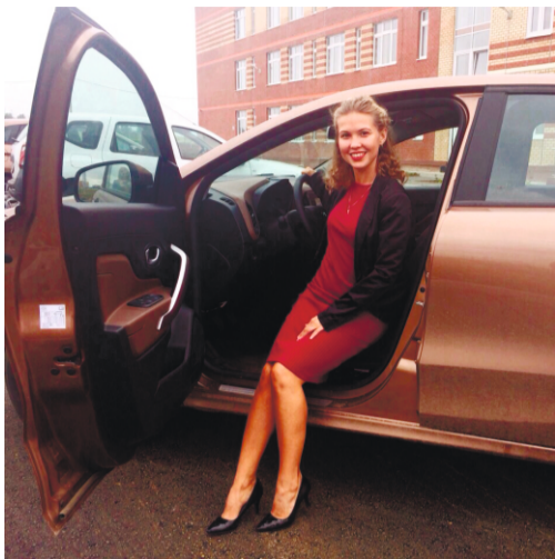
доставляют педагогов в общей сложности в 6 школ.

Проект «Мобильный учитель» работает в Пермском крае уже несколько лет. Впервые о нём заговорили в 2013 году, а уже сейчас в 18 районах Пермского края работает 41 «мобильный учитель», 77 школ края решили таким образом кадровые сложности.